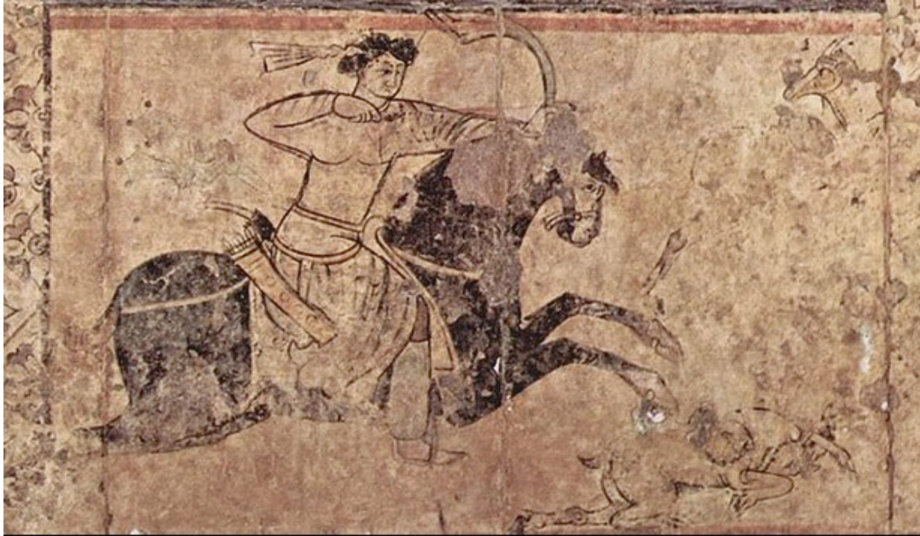
Peinture de KSAR Omeyyade al Hayr al Gharbi VIIe siècle-Musée National de Damas Le premier cavalier archer arabe, assis sur une selle à pommeau élevé, avec étriers.

Christine Lauer, IA-IPR d'Histoire géographique, Académie de Lyon